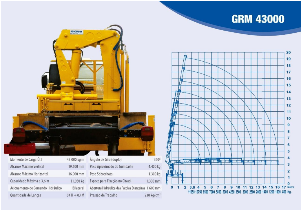
Figura nº 30 – Modelo GRM 40000

O GRM 45000 é indicado para trabalhos que envolvem máquinas pesadas, pré-moldados de concreto mais pesados e grandes obras de construção civil e infraestrutura. Uma vantagem deste modelo é a sua largura, que não ultrapassa a largura da carroceria do caminhão em que ele é instalado. Isso faz com que as manobras do caminhão com o guindaste fiquem muito mais seguras.