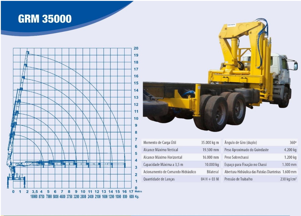
Figura nº 28 – Modelo GRM 35000

O GRM 40000 é indicado para cargas pesadas de grandes indústrias, com destaque para usinas de açúcar, prestadores de serviços, pré-moldados, infraestrutura, empresas de locação de guindastes e construção civil. Outra vantagem oferecida aos interessados neste equipamento é o seu projeto de instalação no caminhão, que é feito pelo Departamento de Engenharia de maneira exclusiva e gratuita para cada cliente.